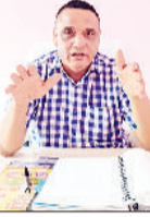
को पहले ही स्पष्ट निर्देश जारी कर दिए गए हैं। उन्होंने कहा कि इस बार खरीद प्रक्रिया पूरी तरह पारदर्शी और व्यवस्थित रखने पर विशेष जोर दिया गया है। शहर में जाम की समस्या को देखते हुए प्रशासन ने