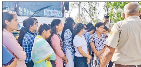
सांपला। बस को पुराने रूट पर रवाने करवाते पुलिस अधिकारी।

छात्राओं के लिए संचालित रोडवेज बस का रूट बिना किसी पूर्व सूचना और लिखित आदेश के बदले जाने पर सोमवार सुबह सांपला में विरोध देखने को मिला। रोजाना रोहतक-समराना-सांपला-इस्माईला मार्ग पर चलने वाली बस को आज दतोड़-आटायल-पाकस्मा होते हुए रोहतक भेजा जा रहा था, जिससे छात्राओं को असुविधा हुई। इस पर करीब 10-15 छात्राओं ने बेरी रोड, सांपला पर बस को रुकवाकर विरोध जताया। उनका कहना था कि बिना पूर्व सूचना रूट परिवर्तन से उनकी पढ़ाई प्रभावित