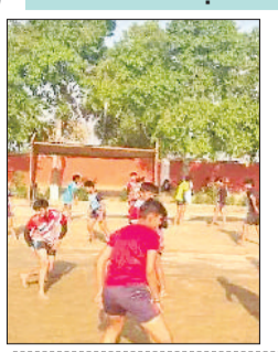
खेल नर्सरियों में सरकार की ओर से खिलाड़ियों को खुराक भता दिया जाता है। 8 से 14 वर्ष तक के खिलाड़ियों को प्रतिमाह 1,500 रुपये और 15 से 19 वर्ष आयु वर्ग के खिलाड़ियों को प्रतिमाह 2,000 रुपये की राशि दी जाती है। इसका उद्देश्य खिलाड़ियों को पर्याप्त पोषण उपलब्ध करवाना है।