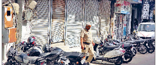
बैंक के बाहर पुलिस कर्मी।

कोटक महिंद्रा बैंक और एयू स्माल फाइनेंस बैंक में सामने आए 160 करोड़ रुपये के गबन मामले की गूंज अब रोहतक तक पहुंच गई है। सोमवार सुबह अचानक हुई जांच कार्रवाई से शहर के बैंकिंग क्षेत्र में हलचल मच गई। पंचकूला से आई जांच टीम ने दोनों बैंकों की शाखाओं में पहुंचकर दस्तावेजों और लेन-देन से जुड़ी जानकारी की पड़ताल की।